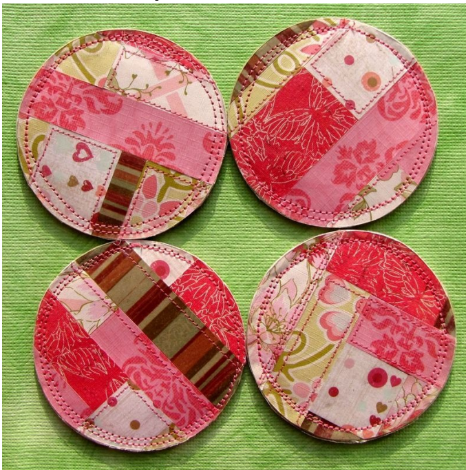
2010 january «Sweet Nothings» Specialty Kit (Scrapmuse)