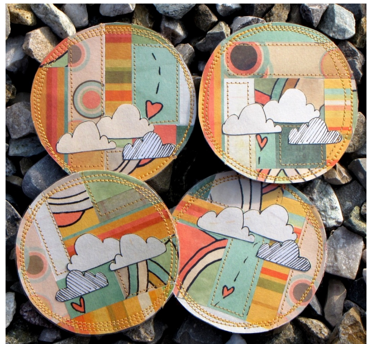
Sausan Designs' Love Generation papers

Hope you'll enjoy this little step by step... Visit me here: http://polinka.canalblog.com